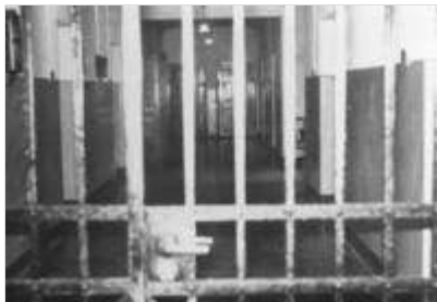
Der Zellenrakt in der Gedenkstätte in Herford.

Tausend Kinder besuchen jedes Jahr die Gedenkstätte Herford, die mit wechselnden Ausstellungen aus der Geschichte des Kreises und der Stadt über das Unrecht des Nationalsozialismus und demokratiefeindliches Denken der Gegenwart informiert.